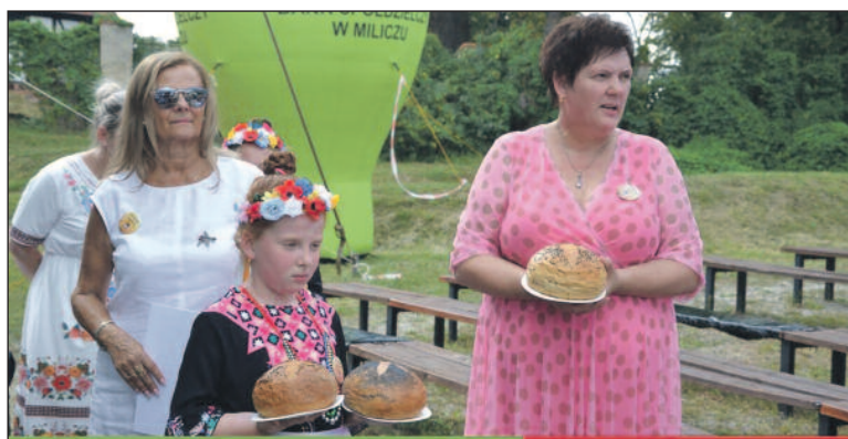
Dożynki w Sułowie